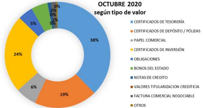
Negociaciones mercado de valores OCTUBRE 2020 según tipo de valor