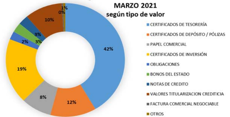
Negociaciones mercado de valores MARZO 2021 según tipo de valor